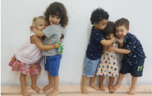
Au jardin d'enfants de Neve Shalom Wahat al-Salam

Les écoles, de la maternelle à la sixième année, connaissent un excellent développement. 315 enfants de plus de 20 communes y sont scolarisés. 52% des enfants sont palestiniens, 48% juifs. Un peu plus de la moitié sont des garçons. Ainsi, le nombre d'élèves a presque doublé en cinq ans. Aujourd'hui, il y a onze classes à l'école primaire , deux de la première à la cinquième classe, une sixième classe. Il y aura douze classes à partir de la prochaine année scolaire. L'objectif est toujours que l'école dispense un enseignement secondaire.