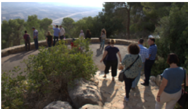
Participants d'un cours d'agent de changement pour les architectes et les urbanistes du nord d'Israël

23 participants ont participé à un "Cours d'agent de changement" de l'École de la paix pour les architectes et urbanistes arabes et juifs organisé en coopération avec le Centre arabe pour les urbanistes alternatifs .