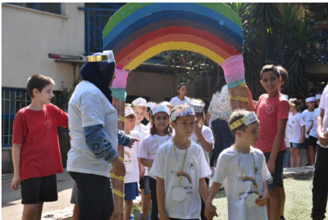
Les élèves de première année de primaire (CP) à Neve Shalom Wahat al-Salam

Les nouveaux élèves entrant au Jardin d'enfants et les élèves de première année de primaire comblent ce vide. Au total, 270 enfants fréquentent à présent les écoles de Neve Shalom Wahat al-Salam. Sur ce nombre, 238 font la navette aller-retour par autobus avec les communes voisines. Désormais, les niveaux 1 à 4 sont effectués deux fois, ce qui nécessite un local supplémentaire (et un besoin d'enseignants !).