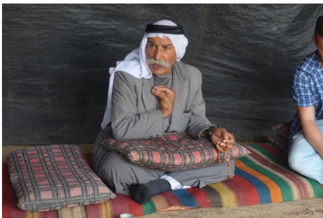
Son village bédouin Al-Araqib dans le Néguev a été détruit 128 fois (!)