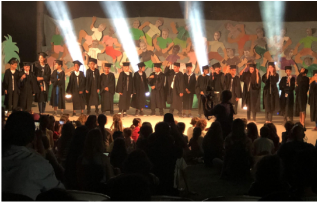
Les élèves de primaire qui quittent l'école primaire de NSWAS

Avant les vacances d'été, les élèves de primaire prenaient traditionnellement congé - ils sont maintenant dans une école publique, dans un environnement sans aucun doute nouveau pour eux. Toutefois, l'expérience a montré que les enfants sont bien équipés pour faire face au changement et s'adaptent parfaitement dans un nouvel endroit.