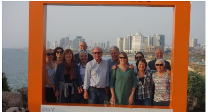
Notre groupe à Jaffa (en arrière plan Tel Aviv)