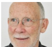
Chers (Chères) Ami(e)s suisses de Neve Shalom / Wahat al-Salam