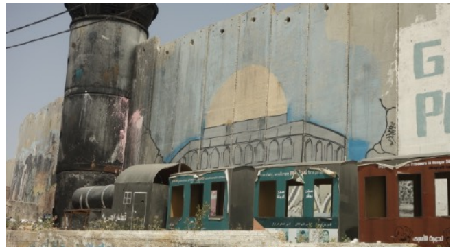
Mur du camp de réfugiés des Nations Unies AIDA près de Bethléem