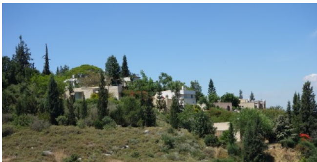
Neve Shalom Wahat al-Salam

Le voyage s'est poursuivi par une visite des institutions pédagogiques pour la paix dans le village, la galerie à Umm el-Fahem avec des œuvres d'art arabe et israélien ou une présentation de livres et échanges au sein même du village. La visite à l'ambassade de Suisse a ouvert une autre perspective. À la fin, le bilan conciliant a servi d'introduction des activités de l'école pour la paix par Nava Sonnenschein.